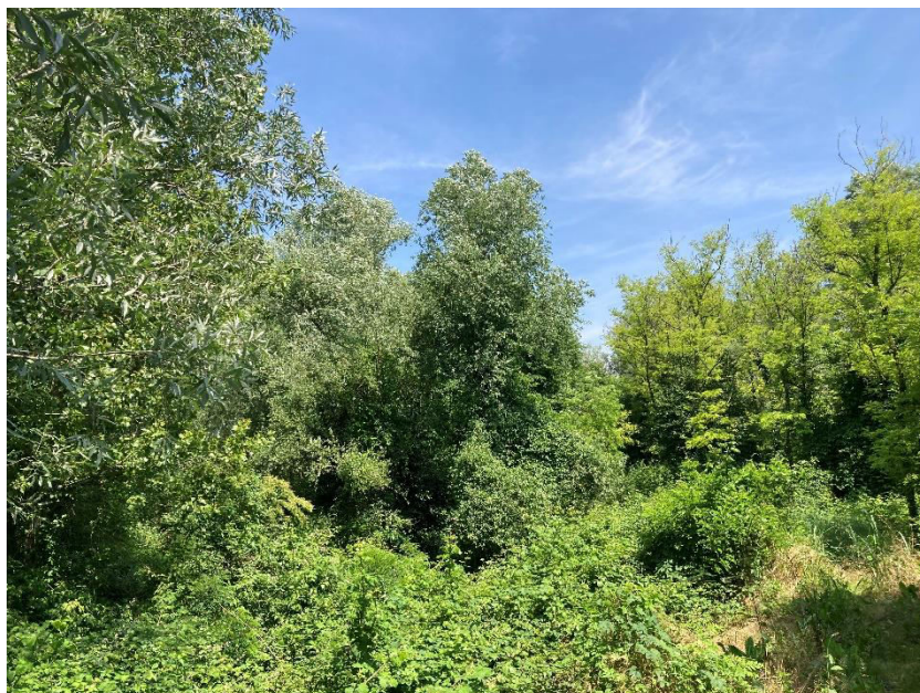
Vista dei mappali 524 e 53