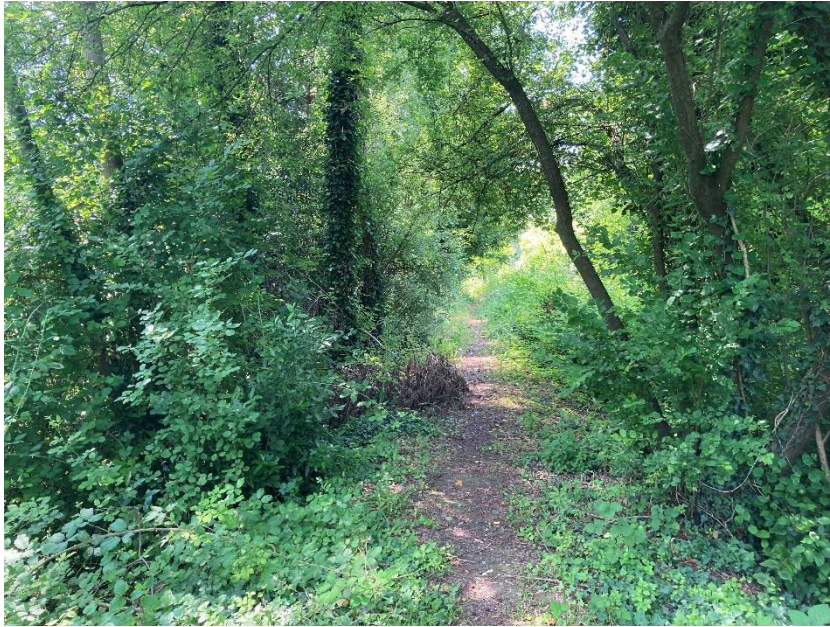
Vista del sentiero lungo l'argina (mappale 523-731-521)