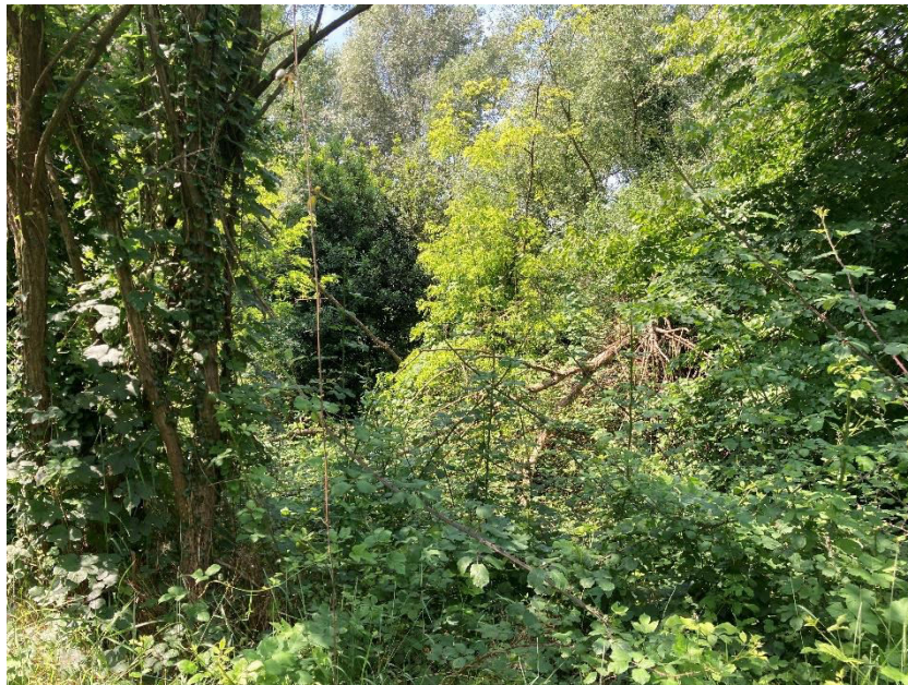
Vista dei mappali 524 e 53