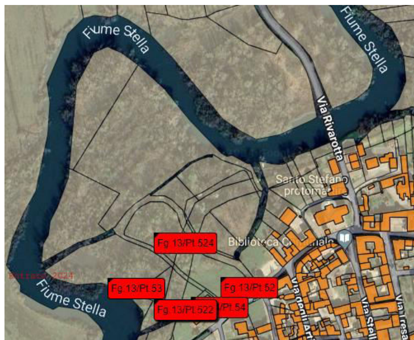
Immagine satellitare "google Earth"