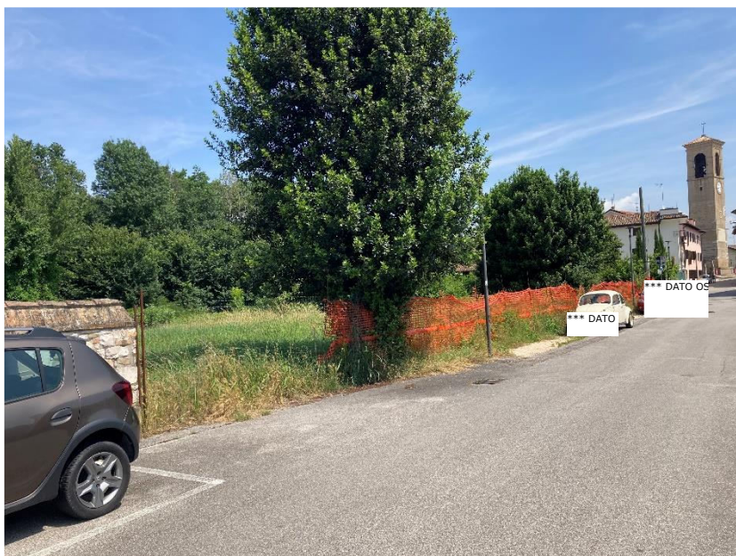
Vista del mappale 52 da via Patriarcale