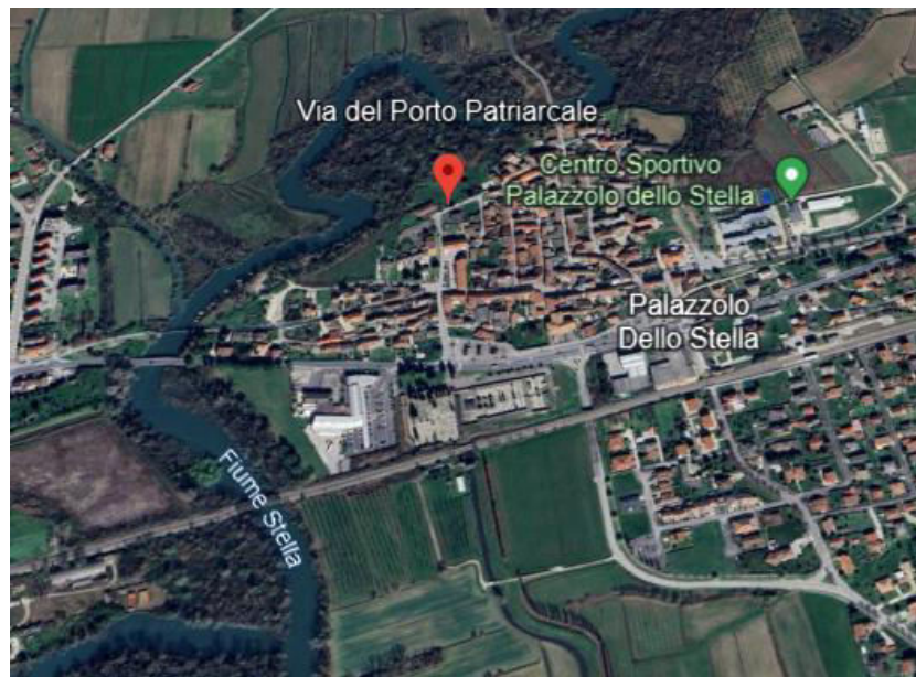
Immagine satellitare "google Earth"