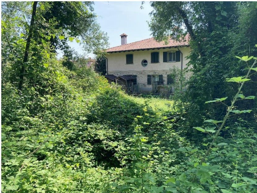
Vista dal sentiero del mappale 54