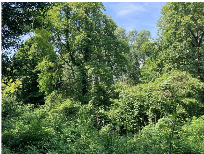
Vista dei mappali 524 e 53