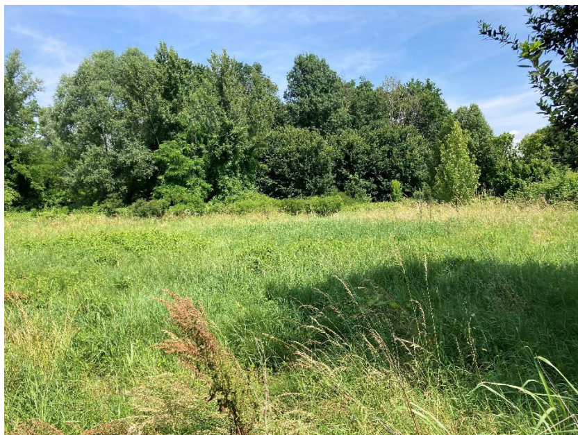
Vista del mappale 52