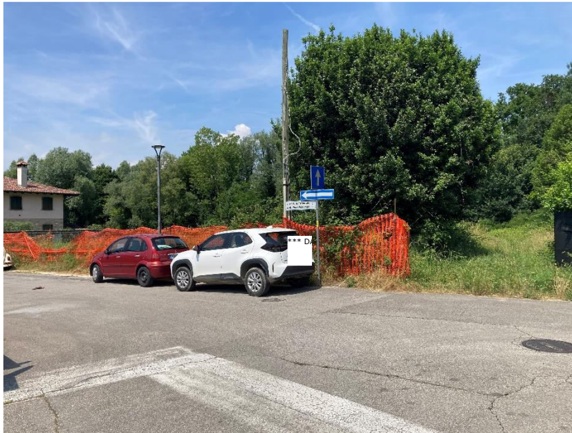
Vista da via Patriarcale mappale 52