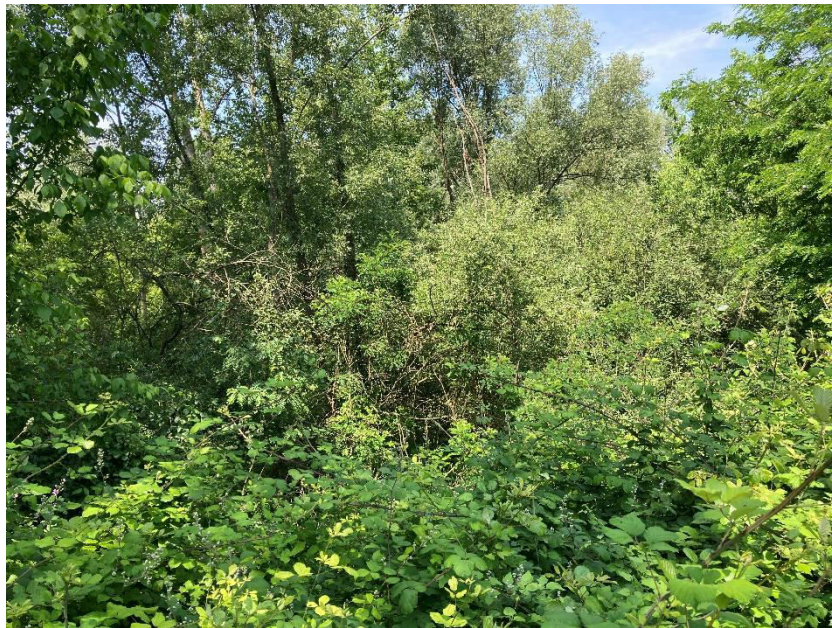
Vista dei mappali 524 e 53