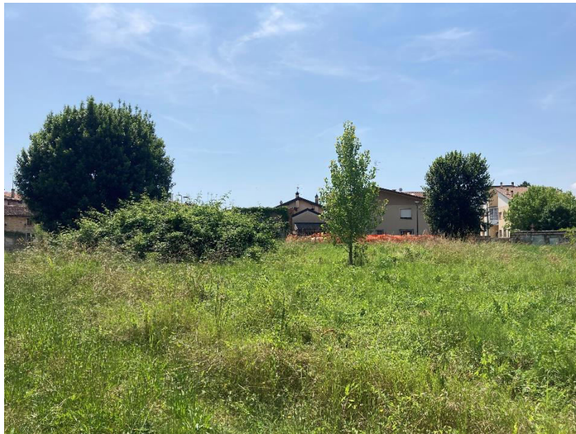
Vista del mappale 52